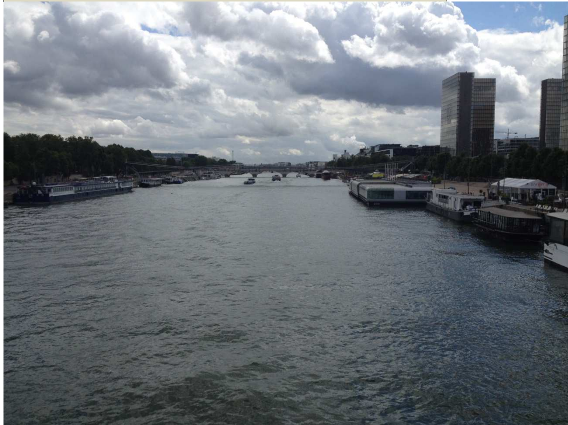
Ciel nuageux - Paris, le 29 juillet